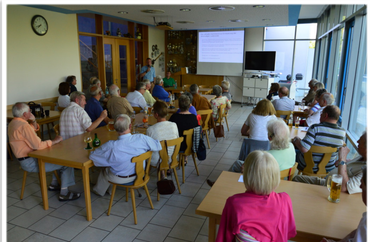
Rege Beteiligung beim ersten Stadtteilforum des Bürgervereins.

Gut besucht war das erste Stadtteilforum des Bürgervereins Süd-West e.V. am 30.06.15, zu welchem erfreulicherweise auch Vertreter verschiedener Stadtratsfraktionen kamen und somit ihr Interesse am Stadtteil bekundeten. Die Themen "ehemalige Ladenzeile" und "Verkehr" beherrschten eine sehr konstruktive Diskussion, bei der sich am Ende alle einig waren, dass eben jene Themen einer aktiven Begleitung aus dem Viertel bedürfen. Der Bürgerverein wird sich diesbezüglich weiterhin gegenüber Politik, Verwaltung und verantwortlich Handelnden für die Bedürfnisse der Bürger des Stadtteils stark machen. Weitere Informationen über die Veranstaltung finden Sie in Kürze auf der Internetseite des Bürgervereins.